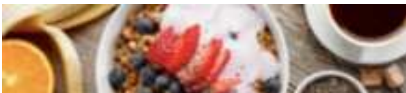
DESAYUNOS: EJEMPLOS ?????

Pan xeixa masa madre Muesli casero Porridge de avena o quinoa Overnight oats Crepes de trigo sarraceno Puding de chía Coca casera Compota frutos rojos sin azúcar